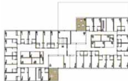
01 «Semiramis»: Gestaffelter Baukörper; 02 Grundrisse 1. +2. OG mit transparenter Mittelzone (Pläne: Ackermann Architekt)

Der Beitrag «Semiramis» von Ackermann Architekt überzeugt mit der präzisen Setzung eines gestaffelten Baukörpers, differenzierten Aussenräumen und einer schlüssigen inneren Organisation.