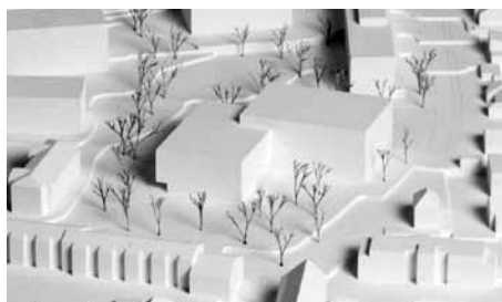
04 Angewinkelter Kubus (Amrein Giger)